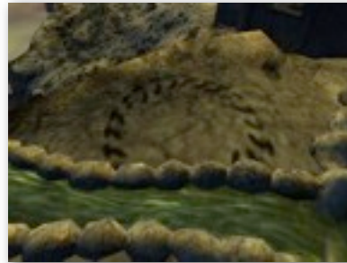
Mysterious Circles..., par Marein (Concours 37)