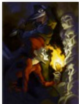
Untitled, par Shoom'lah