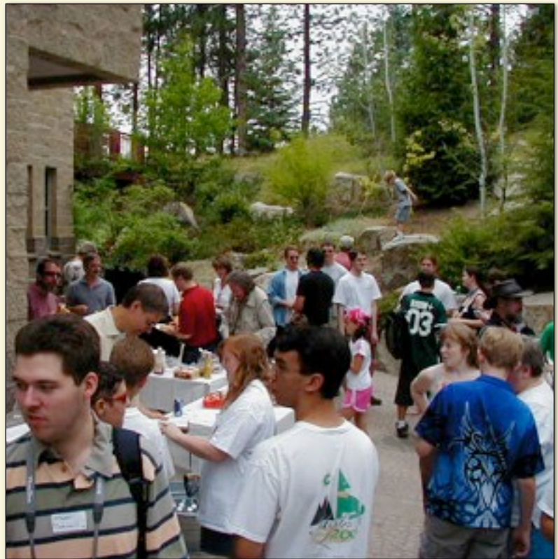
Réunion de fans aux bureaux de Cyan au Mysterium 2003 à Spokane, WA.