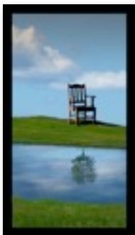
Self-portrait, par FahrmyBoy

Les gagnants du mois sont dans la catégorie ordinateur Shoom'lah et Fahrmy qui ont obtenu 4 votes chacun, et dans la catégorie photographie Wanais avec "Fall."