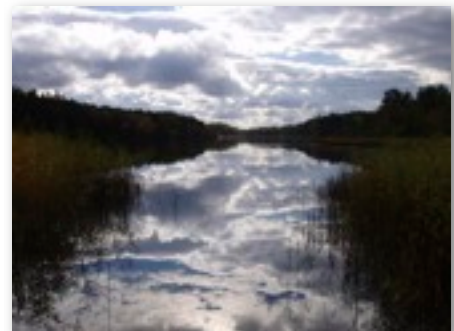
Fall, par Wanais