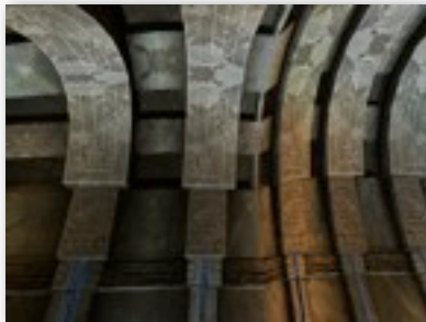
Arcs, par Kaelri (Concours 38)

Le Golden KI est une Ode à uru à travers les photographies des explorateurs. Il y a un concours toutes les deux semaines et c'est la communauté qui vote pour choisir les gagnants.